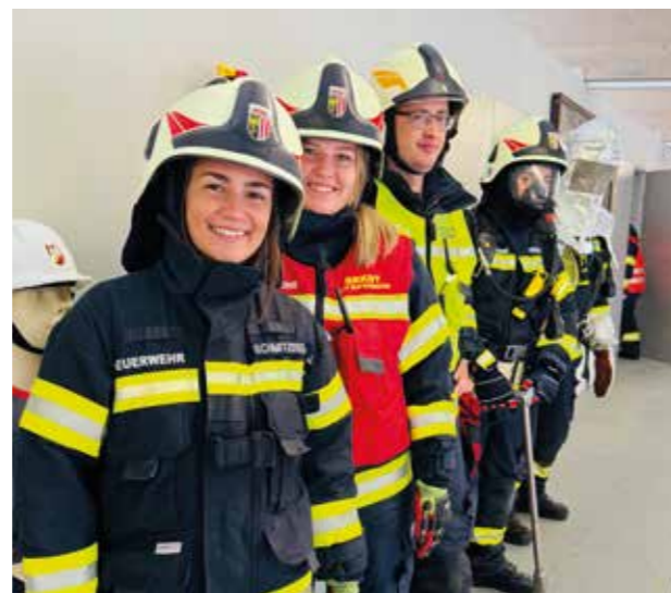
Tag der offenen Tore