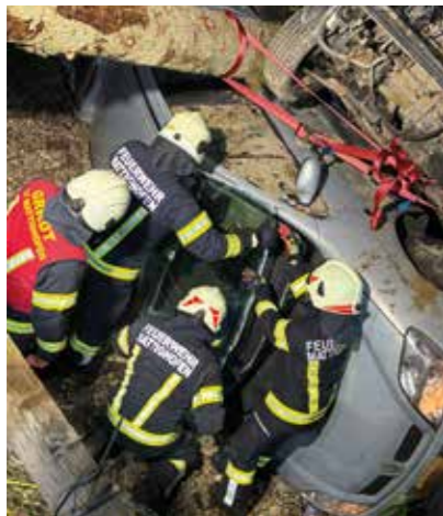
Verkehrsunfall eingeklemmte Person