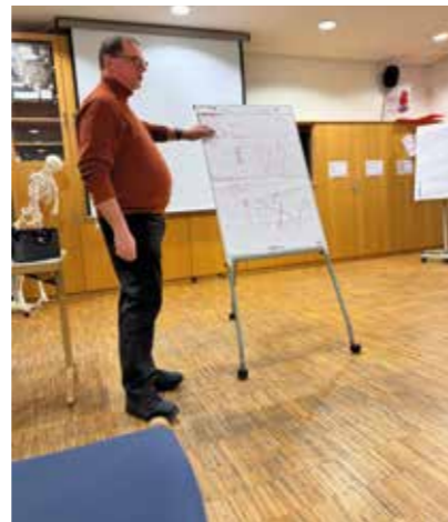
Vortrag Stressverarbeitung nach Einsätzen