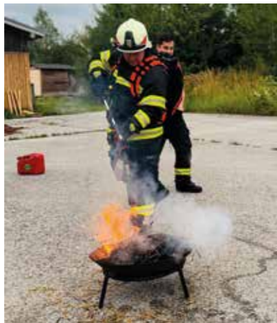
Vorstellung Stützpunkt Waldbrandbekämpfung