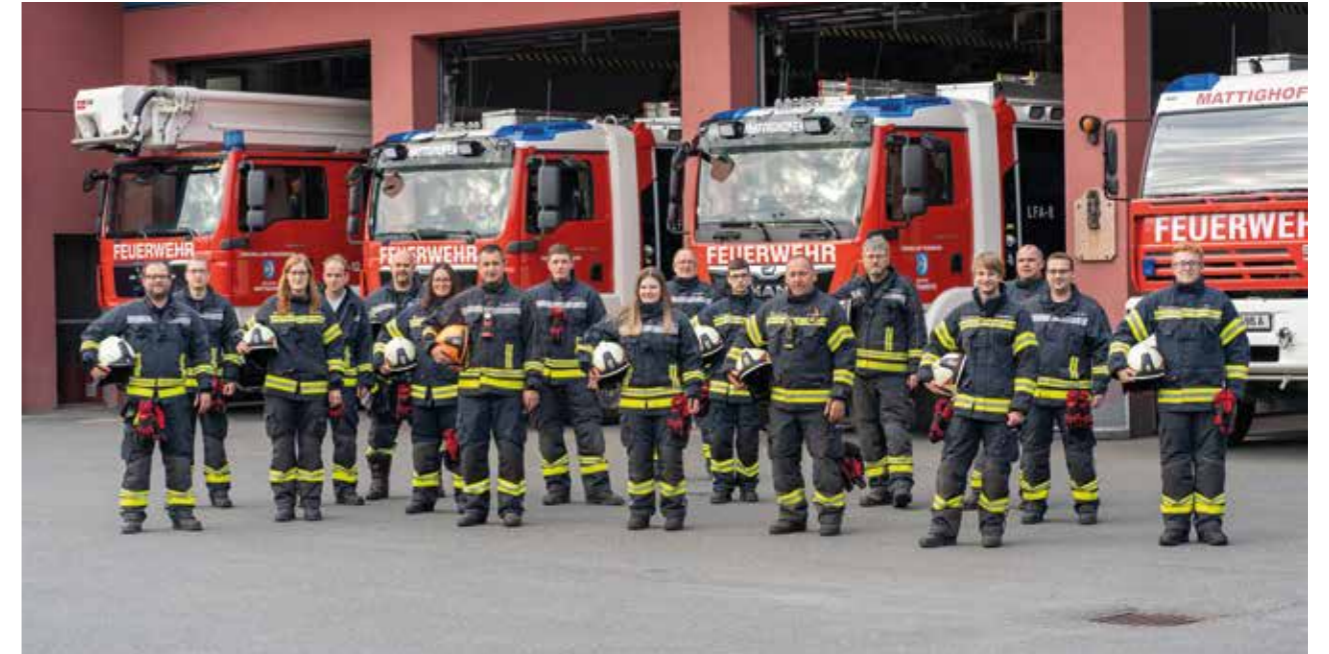
Unsere Mannschaft – freiwillig im Einsatz für Mattighofen

Ein herzliches Dankeschön gilt allen Kameradinnen und Kameraden, der Feuerwehrjugend, unseren Familien sowie der gesamten Bevölkerung von Mattighofen für das Vertrauen und die großartige Unterstützung im Jahr 2025.