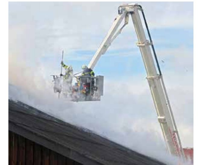
Brand landwirtschaftliches Gebäude