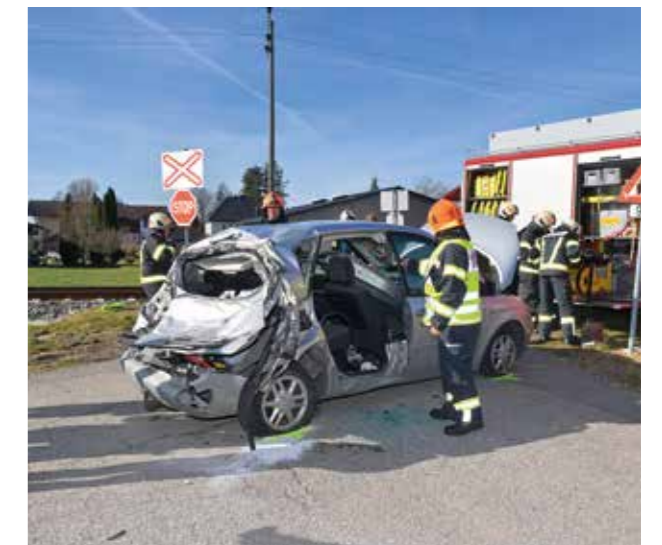
Verkehrsunfall eingeklemmte Person