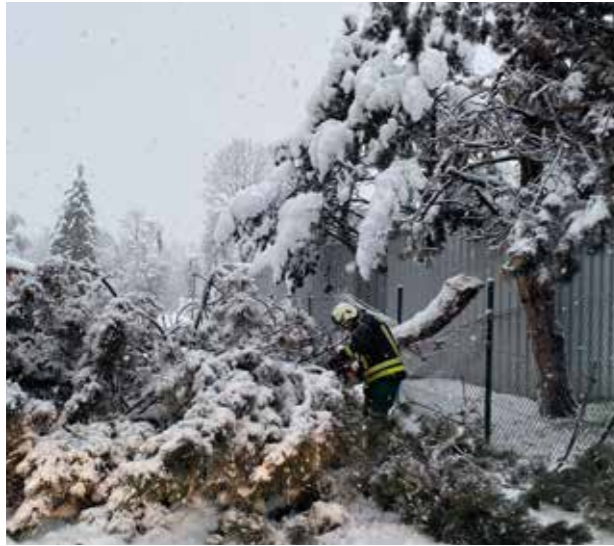
Arbeiten nach Elementarereignis