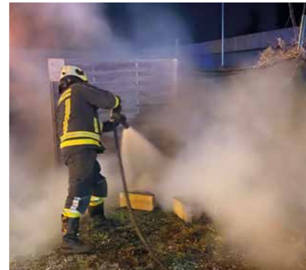
Brand durch Feuerwerkskörper