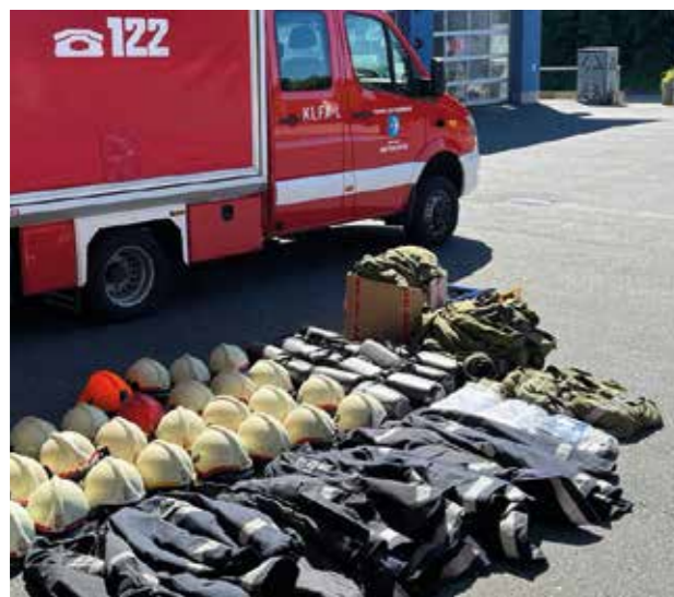
Sachspenden für die griechischen Feuerwehren