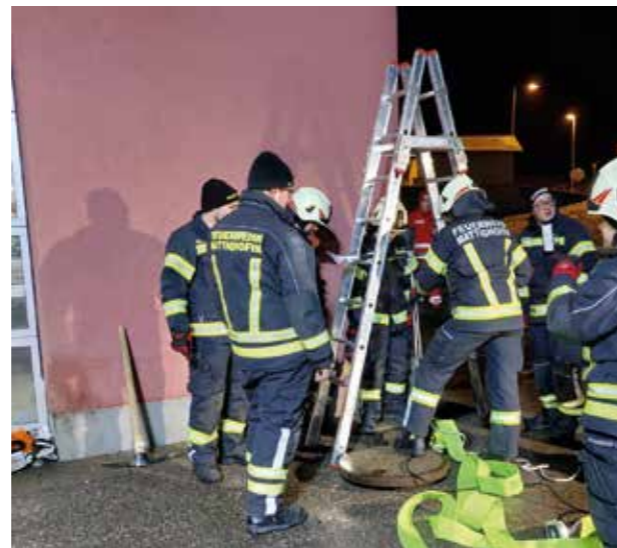
Heben von Lasten