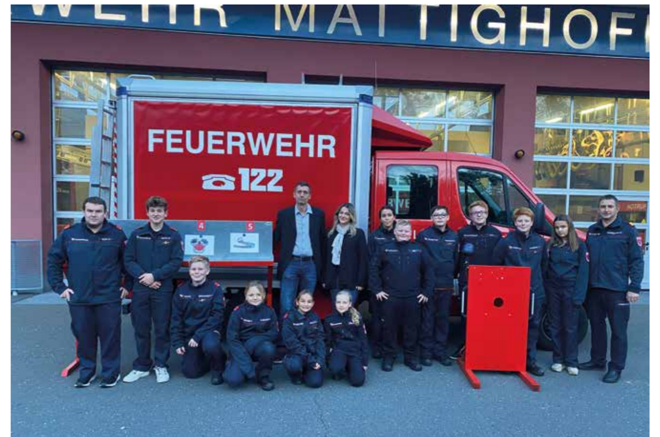
Überreichung des gesponserten Bewerbungsequipments von Firma Kletzl Metalltechnik