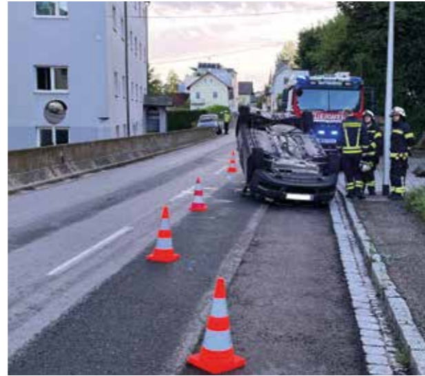
Aufräumarbeiten nach VKU