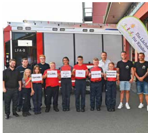
Spendenübergabe an den Verein „Ein Lächeln für Kinder“

Ein Teil des Erlöses der Sammlung wird jedes Jahr für einen guten Zweck bzw. an hilfsbedürftige Familien oder Personen im Raum Mattighofen gespendet. Der Hauptteil wird für die Jugendarbeit in der Feuerwehr verwendet.